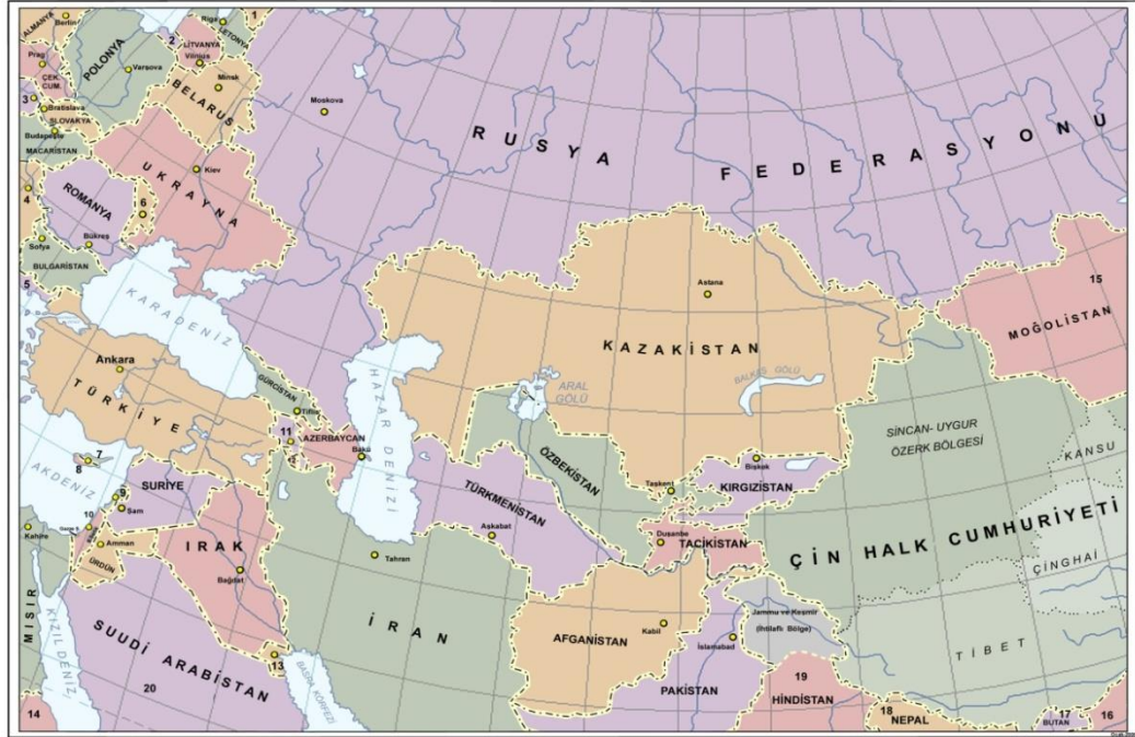
Şekil 1. Avrasya Siyasi Haritası ve Orta Asya Devletleri 6