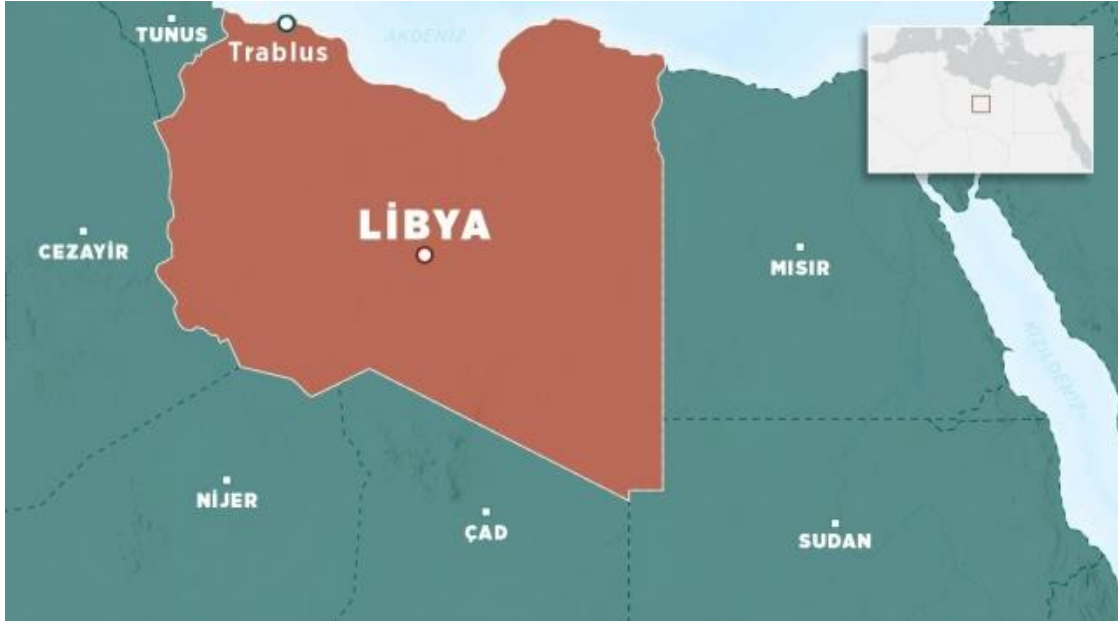
Harita 2.1. Libya Genel Haritası

“Kuzeyde Akdeniz ve güneyde Ekvator Afrika'sı arasında bir kum denizine benzeyen Büyük Sahra Çölünün, yaklaşık 1300 km uzunluğundaki büyük bir bölümü, Libya topraklarının tamamına yakın kısmını meydana getirir. Çevresel faktörler de Libya'nın tarımsal potansiyelini sınırlı hale getirmektedir. Libya'nın %90'ını oluşturan çöl nedeniyle tarıma elverişli alan, Libya topraklarının sadece %1,7 si ile sınırlıdır.”( http://www.birlesmismarkalar.org.tr/uploads/Libya.pdf ).