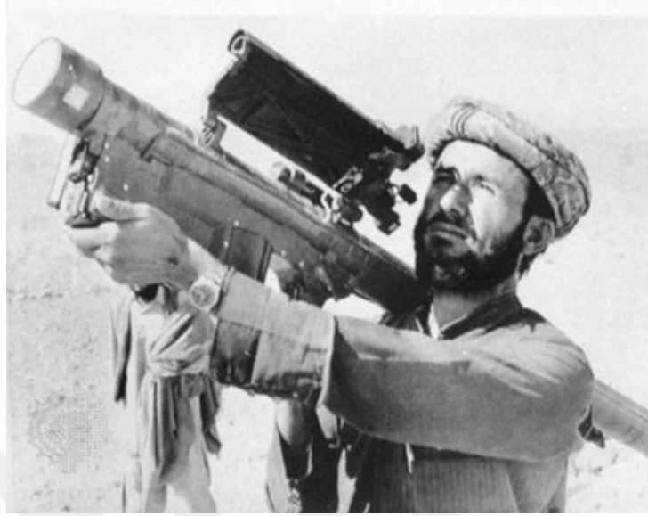
Stinger füzesi kullanan mücahit fotoğrafı

Bu silah o kadar etkiliydi ki Sovyet ve Hint yapımı helikopterleri hedef kaçırmadan bir düşürecektir kapasitedeydi.