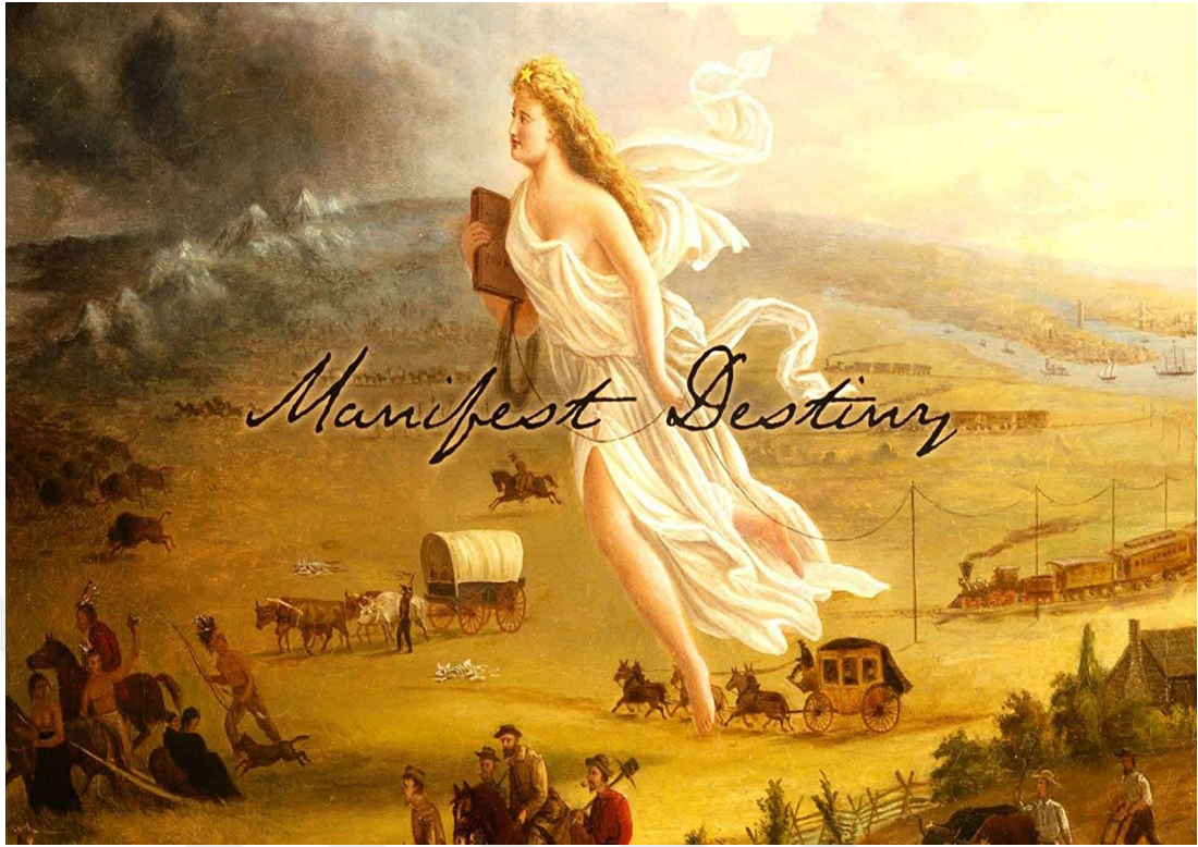
AMERİKAN KUTSAL MİSYONU HAKKINDA BİR GÖRSEL ( Manifest Destiny (2011))