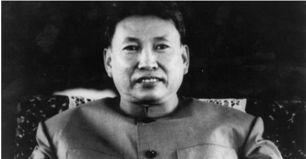
POL POT-Century of Genocide (Samuel Totter, Cambodian Genocide)

Bu ülkede yaşanan olaylara, Khmerlerin yaptığı tüm soykırıma batı dünyası özellikle de Birleşmiş Milletler sessiz kalıyordu. Hatta Pol Pot Birleşmiş Milletler toplantılarında Kamboçya'yı temsil etmeye devam ediyordu. Bu dönemde İngiltere ve ABD Khmer Rouge'a gizli destek veriyordu, çünkü olası bir Vietnam işgalinin ülkeyi Sovyetler bloğuna kaydıracağını düşünüyorlardı. Yönetim, hastaneleri, Budist tapınaklarını, fabrikaları ve okulları boşaltmış ve kütüphaneleri yakmıştı. Yüzbinlerce vatandaş çalışma kamplarına alınmış ve milyonlarca kişi toplu yemek dağıtım noktalarında yemek almak için şanslarını deniyorlardı. Bu ülkenin halkını kurtaran şeyse Vietnam'ın Kamboçya'yı işgal etmesi oldu.