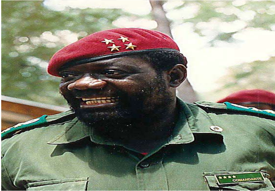
UNITA Lideri Jonas Savimbi

Tüm bunlar gerçekleşirken Dışişleri Bakan Chester Crocker MPLA ile görüşmeler yapıyordu. Chester'a göre ülkedeki karışıklığın çözümü UNITA değil, MPLA ile yapılacak diplomatik kontaklardı. Chester UNITA'yı sadece koz olarak kullanmak gerektiğini düşünüyor ve diplomatik görüşme zeminini oluşturuyordu. Chester sayesinde başlayan Angola, Küba ve Güney Afrika devletlerinin kontakları sırasında Chester defalarca Küba birliklerinin Angola'dan ayrılmasından sonra yeni bir seçim yapılması gerektiğini ve bunun Angola'nın iç meselesi olduğunu, ABD'nin bu konuda müdahil olmaması gerektiğini belirtmiştir. 41 Angola'da “geri dönüş” için gerekli olanın askeri mücadele değil, politik zemin olduğunu savunmuş ve bunun için gerekli diplomatik zemini hazırlamıştır. Muhafazakar kanattan çok ciddi eleştiriler alan bu politikalar, her ne kadar görmezden gelinse de MPLA ile yapılan anlaşmaların zeminini oluşturmuştur.