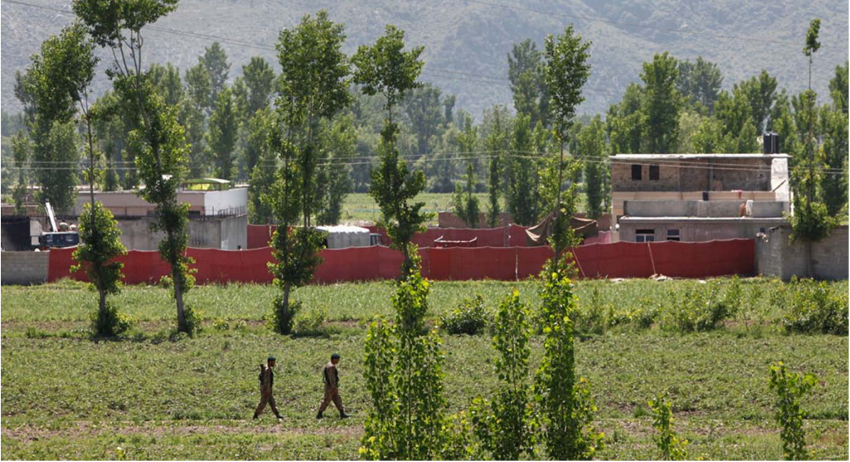
Usame Bin Ladin'in Pakistan'sa öldürüldüğü evin çevresi operasyon sonrası da sıkı denetim altında tutuldu.