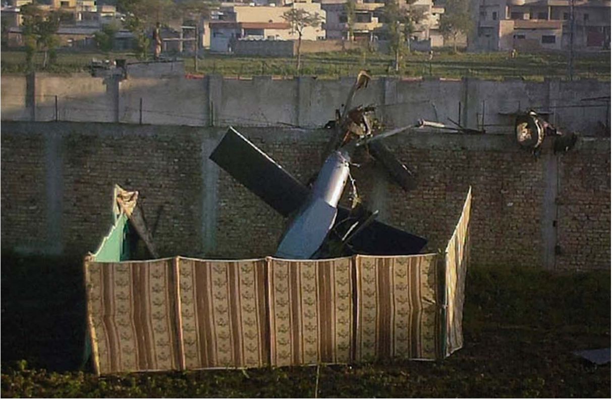
Bin Laden'in ölü ele geçirildiği operasyonda bir helikopterin teknik arıza yüzünden kaybedildiği açıklanmıştı.