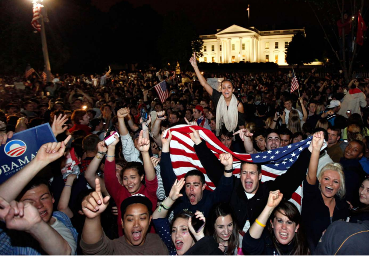
Bin Ladin'in ölü ele geçirilmesinin ardından ABD'liler büyük sevinç gösterisi yapmıştı.