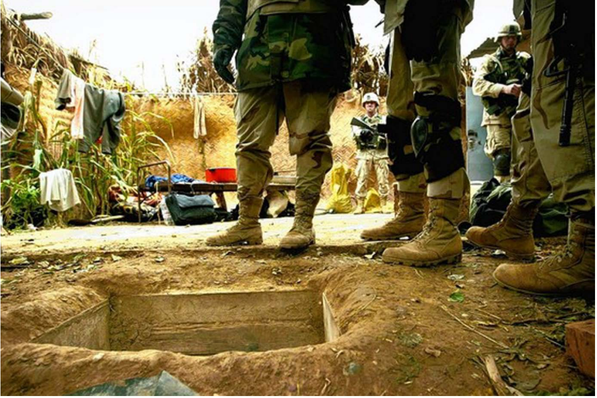
Saddam Hüseyin'in yakalandığı kuyunun fotoğrafı da gazetelerde yer almıştı.