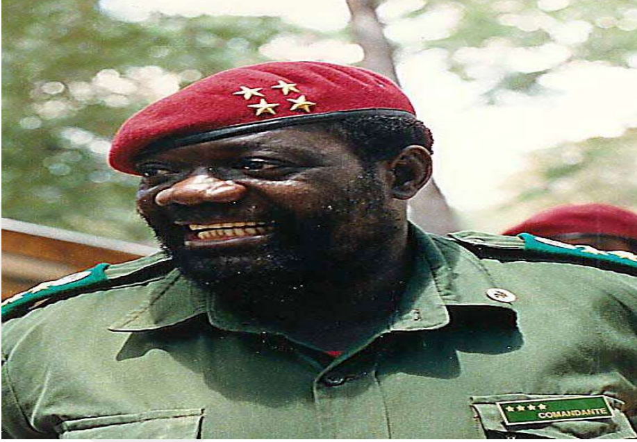
UNITA Lideri Jonas Savimbi

Tüm bunlar gerçekleşirken Dışişleri Bakan Chester Crocker MPLA ile görüşmeler yapıyordu. Chester'a göre ülkedeki karışıklığın çözümü UNITA değil, MPLA ile yapılacak diplomatik kontaklardı. Chester UNITA'yı sadece koz olarak kullanmak gerektiğini düşünüyor ve diplomatik görüşme zeminini oluşturuyordu. Chester sayesinde başlayan Angola, Küba ve Güney Afrika devletlerinin kontakları sırasında Chester defalarca Küba birliklerinin Angola'dan ayrılmasından sonra yeni bir seçim yapılması gerektiğini ve bunun Angola'nın iç meselesi olduğunu, ABD'nin bu konuda müdahil olmaması gerektiğini belirtmiştir. 41 Angola'da "geri dönüş" için gerekli olanın askeri mücadele değil, politik zemin olduğunu savunmuş ve bunun için gerekli diplomatik zemini hazırlamıştır. Muhafazakar kanattan çok ciddi eleştiriler alan bu politikalar, her ne kadar görmezden gelinse de MPLA ile yapılan anlaşmaların zeminini oluşturmuştur.