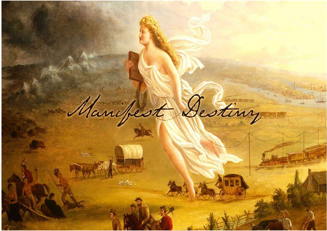
AMERİKAN KUTSAL MİSYONU HAKKINDA BİR GÖRSEL ( Manifest Destiny (2011))