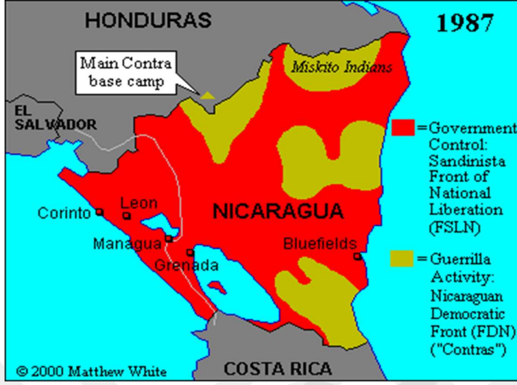
Nikaragua'daki İç Savaşın Gösteren Bir Harita (sites.google.com)

Bu kararlar alındıktan sonra CIA zaman kaybetmeden işe koyuldu. CIA ilk önce Arjantin ve Honduras orduları üzerinden Nikaragua'daki hükümet dışı aktörlere danışmanlık, eğitim, yardım ve ekipman verdi ve bir süre sonra da kendisi doğrudan organizasyona dahil oldu. Kontraların en tartışılan ve bu çalışmanın üçüncü bölümünde doktrinin eleştirel değerlendirilmesi bölümünde detaylı olarak tartışılacak eylemleri ilk bir yıl içinde olmuştur. Kontralar aldıkları yardımlarla ilk bir yıl içinde sadece askeri personeli hedef almamış aynı zamanda tarım ve ortak alanlara zarar verecek; doğrudan köylüleri hedef alacak saldırılarda bulunmuşlardır. Medyada Sandinistalılar ve Kübalıların ülkede yapmış oldukları insanlık suçları ile örtülen bu faaliyetler uzun bir süre devam etmiştir. 1982 ve 1984 yıllarında Kongre Kontraların Amerikan amaçlarına hizmet edemeyecek kanlı bir örgüt olduğu yönünde karar aldı ve Başkanın yardımlarının devam edemeyeceği yönünde kararlar aldı. Reagan her ne kadar yaptığı konuşmalarla kongreyi ikna etmeye çalışsa da başarılı olamadı. Bunda William Casey'in 7000'den fazla personel göndermesi ve yıl sonu yardım miktarının 45 milyon doları açması büyük etken oldu. 55 Yönetim bu kararların ardından bir