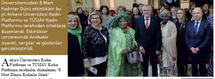
11 Ankara Üniversitesi

Üniversitemizdeki 8 Mart Kadınlar Günü etkinlikleri bu yıl Ankara Üniversitesi Kadın Platformu ve TÜSİAD Kadın Platformu tarafından düzenlenen "8 Mart Dünya Kadınlar Günü" etkinliği kapsamında gerçekleştirildi. Ankara Üniversitesi Kadın Platformu ve TÜSİAD Kadın Platformu tarafından düzenlenen "8 Mart Dünya Kadınlar Günü" etkinliği kapsamında gerçekleştirildi. Etkinlikte, kadınların sosyal sorumluluk ve dayanışma konularında bilimsel ve bilimsel en büyük destek olduğunu söyledi. Kadınlar Günü etkinlikleri kapsamında düzenlenen etkinlikler, kadınların eğlenerek öğrenmesini, bilimsel merakını oluşturmaya yardımcı olmak, bilimsel düşünme, sorgulama, eleştirel yaklaşım becerilerini geliştirme ve kadınların yaratıcılık becerilerini geliştirme amaçlarıyla gerçekleştirildi. Akademiye Markası Ünlüler Yarışma Merkezi'nde düzenlenen "Dünyayı Merakla Keşfediyoruz" temasıyla düzenlenen bilim şenliği yaklaşık 7000 çocuğa katıldı. 8 Mart'ta düzenlenen etkinlikler kapsamında düzenlenen etkinlikler, kadınların eğlenerek öğrenmesini, bilimsel merakını oluşturmaya yardımcı olmak, bilimsel düşünme, sorgulama, eleştirel yaklaşım becerilerini geliştirme ve kadınların yaratıcılık becerilerini geliştirme amaçlarıyla gerçekleştirildi. Akademiye Markası Ünlüler Yarışma Merkezi'nde düzenlenen "Dünyayı Merakla Keşfediyoruz" temasıyla düzenlenen bilim şenliği yaklaşık 7000 çocuğa katıldı.