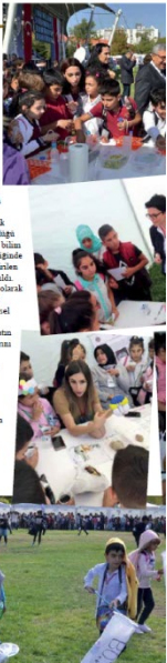
10 Ankara Üniversitesi