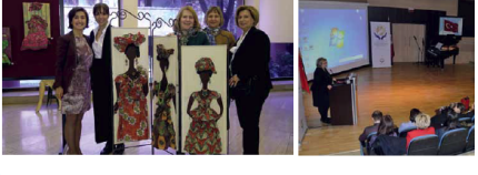
22 Ankara Üniversitesi