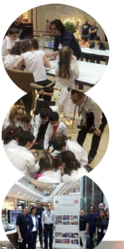
12 Ankara Üniversitesi