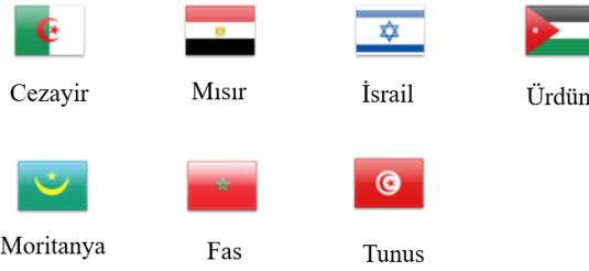
Şekil 2: Akdeniz Diyalogu Ülkeleri

NATO'nun ortaklık anlayışı doğrultusunda 1994 yılında hayata geçirdiği diğer program ise Akdeniz Diyalogu (MD) olmuştur. Akdeniz Diyalogu platformunun temel amacı, katılımcı NATO üyesi olmayan ülkeler (Şekil 2'e bkz.) ile NATO arasında olumlu diplomatik ilişkileri ve karşılıklı anlayışı geliştirmek, böylece iş birliğine dayalı bir güvenlik ortamını teşvik etmektir (NATO, 2024d). Gelişmiş bölgesel diyalog ve iş birliği yoluyla istikrarlı ve öngörülebilir bir güvenlik ortamının desteklenmesine yönelik ortak taahhütleri bakımından Akdeniz Diyalogu programı ile BİO programı aynı temel hedefte birleşmektedir.