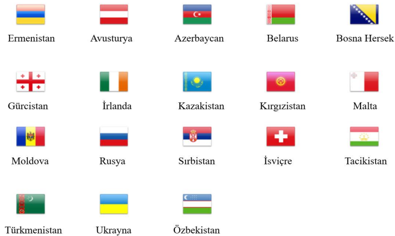
Şekil 1: Barış İçin Ortaklık Ülkeleri