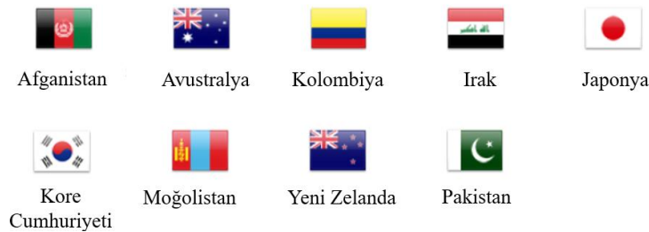
Şekil 4: Küresel Ortaklar

2004 sonrasında NATO'nun değişen güvenlik ortamına uyumu devam etmiş ve Kuzey Atlantik Antlaşması'nın 10. maddesinde ifade edilen açık kapı politikasıyla uyumlu bir şekilde, belirli coğrafi sınırlamaları aşarak küresel barış ve istikrara kendini adanmış uluslarla iş birliği modellerinin geliştirilmesinde kendini göstermiştir. Bu temelde NATO 2006 yılında, yerleşik ortaklık çerçevelerinin ötesinde, Küresel Ortaklar (Şekil 4'e bkz.) olarak adlandırılan çeşitli uluslarla bireyselleştirilmiş iş birliği platformunu hayata geçirmiştir (Çetinkaya, 2020). Günümüzün karmaşık güvenlik ortamında stratejik önemi giderek artan bu anlayış, geleneksel coğrafi sınırları aşan ülkelerle oluşturduğu geniş çaplı bir ortaklık yaklaşımı, ittifakın küresel bir örgüt olduğunu ortaya koymaktadır. 2021 yılında ABD'ni Afganistan'dan ayrılma karar alması ve NATO'nun da Afganistan'dan çekilmesi sonrası yaşanan gelişmeler neticesinde, NATO'nun Afganistan ile ortaklık ilişkileri, NAC'in güvenlik ortamına ilişkin aldığı kararlar neticesinde anda askıya alınmış durumdadır (NATO, 2024ç). Tüm bu girişimler NATO'nun Soğuk Savaş sonrası dönemde daha geniş bir güvenlik rolüne olan ihtiyacını ortaya koymuştur (Tavukcu, 2001).