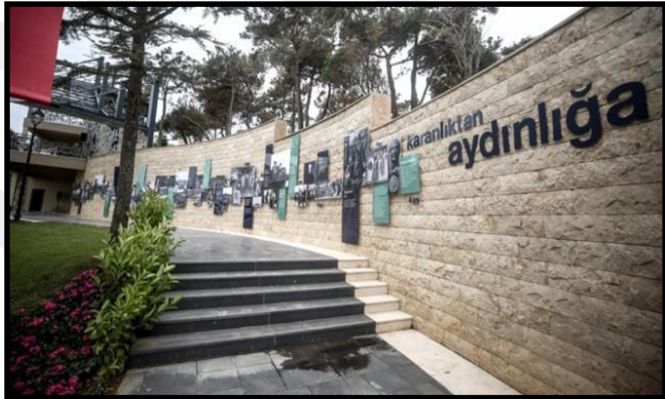
Fotoğraf 4: Geçmişten bugüne Ada tarihinin yazılı ve görsel anlatıldığı bölüm