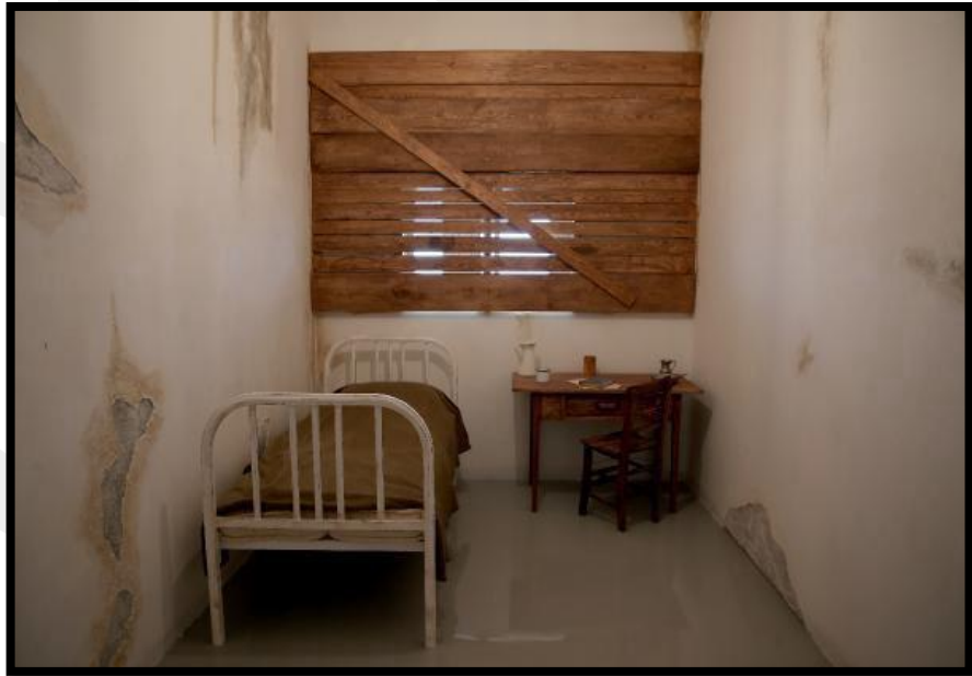
Fotoğraf 8: Adnan Menderes'in Yassıda'da tutuklu kaldığı odayı temsilen.