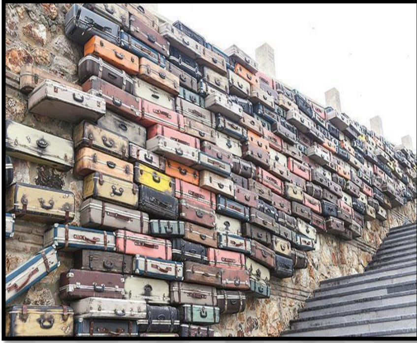
Fotoğraf 3: Mahkumların Ada'ya getirilirken alıkoyulan bavullarını simgeleyen bir yapı.