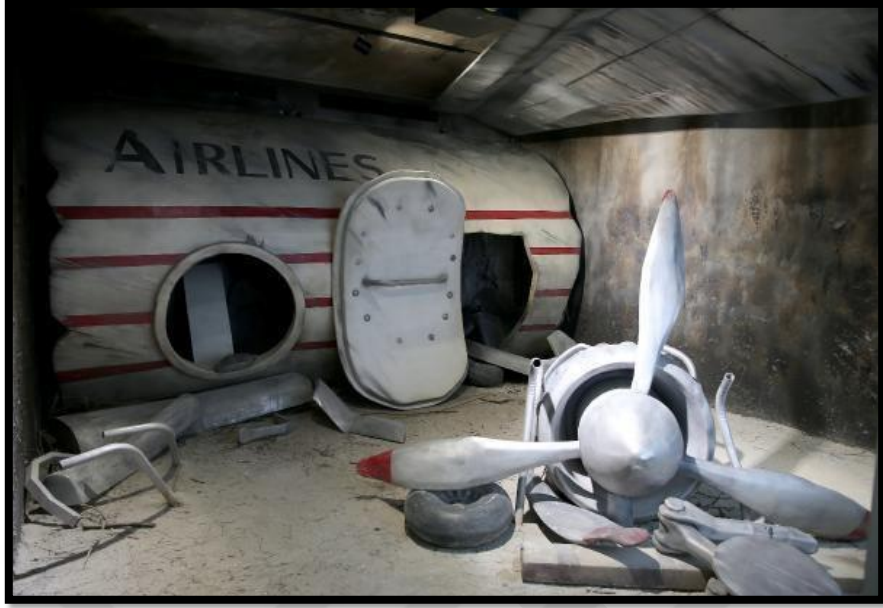
Fotoğraf 9: Adnan Menderes'in 17 Şubat 1959 tarihinde Londra Antlaşması için İngiltere'ye doğru giderken geçirdiği uçak kazasını temsilen bir fotoğraf.