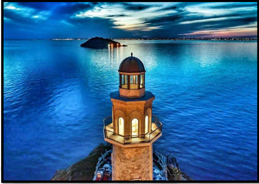
Fotoğraf 7: 24 metrelik deniz feneri. Çevredeki adalardan ve İstanbul'un yakın kıyılarında deniz fenerinin ışıkları görülebiliyor.