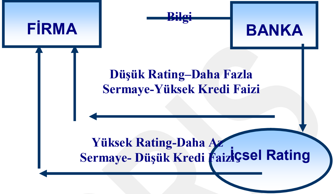
Şekil 3.HALKBANK 2007 yayınları

İçsel derecelendirme yaklaşımları bankaların kredi riski değerlendirmelerini kendi bünyelerinde kuracakları derecelendirme (rating) sistemleri vasıtasıyla yapmalarını öngörmektedir. Kurulacak içsel sistemlerle ilgili standartlar Basel-II dokümanında ayrıntılı olarak düzenlenmiş bulunmaktadır. Yapılan düzenlemeler hayli teknik ve komplikedir. Bu açıdan son derece teknik ve kompleks bulunabilecek Basel-II içsel derecelendirme yöntemlerinin aslında kredi riski ölçümünde ulaşılacak son nokta olmadığı bilinmesinde yarar vardır. Bununla birlikte Basel-II içsel derecelendirme yaklaşımlarının, uygulama açısından son yıllarda geliştirilen kredi riski modellerinden daha kolay olduğu kesinlikle düşünülmemelidir. İçsel modeller çok ağır standartlara bağlandığından özellikle ileri içsel derecelendirme yaklaşımını kullanmaya ehil bulunup yetkilendirilebilecek gelişmiş uluslar arası banka sayısının bile ilk etapta sınırlı kalacağı tahmin edilmektedir.