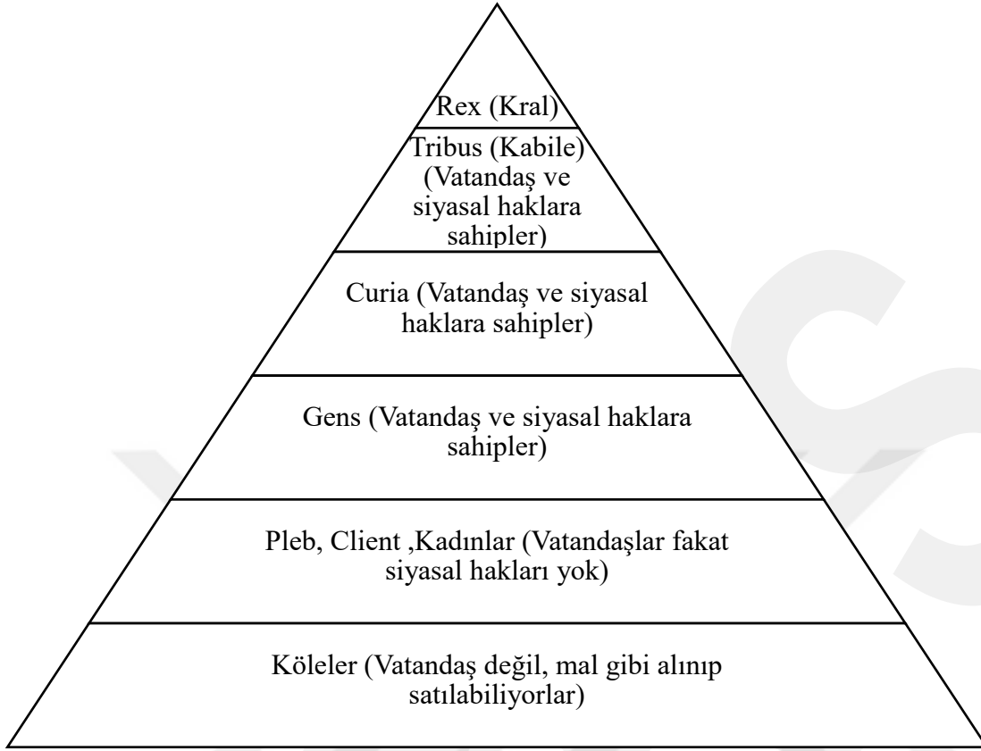
Tablo 2: Roma'da Toplumsal Sınıflar 5

Yeni düzende pleblerin hala tam vatandaşlık haklarından söz edemeyiz, fakat daha sonraki süreçte patriciler ile yaptıkları sınıf çatışmaları sonucunda vatandaşlık haklarının tümüne sahip olmuşlardır (Küçük, 2015). Artık Roma yönetiminde güçlü bir hale gelmelerinin önünde bir engel kalmamıştır. İlerleyen zamanlarda da yönetimde iyice söz sahibi olmayı başarmışlardır.