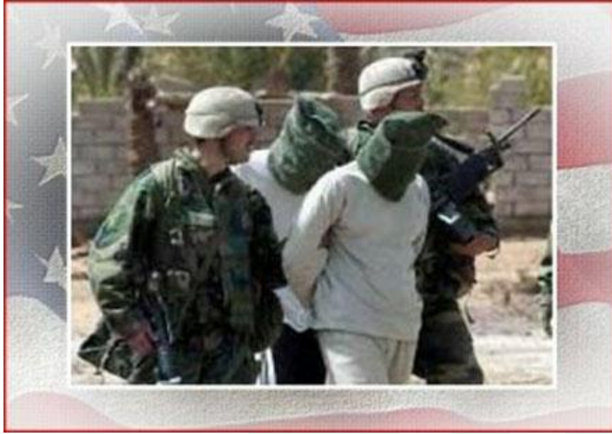
Ek 5: Çuval Olayı'nın medyada oldukça yankı bulmuş fotoğraflarından birisi.