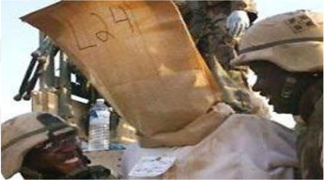
Ek 4: 2003 Irak-Süleymaniye'de başına çuval geçirilen asker.