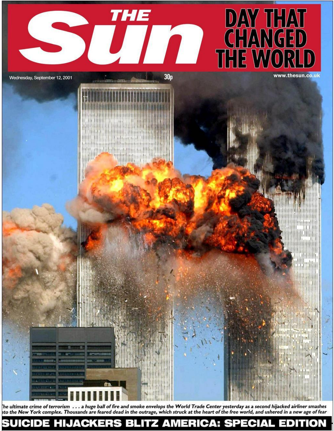
Ek 2: 'Dünya'yı Değiştiren Gün' manşetli The Sun gazetesi: 12 Eylül 2001.