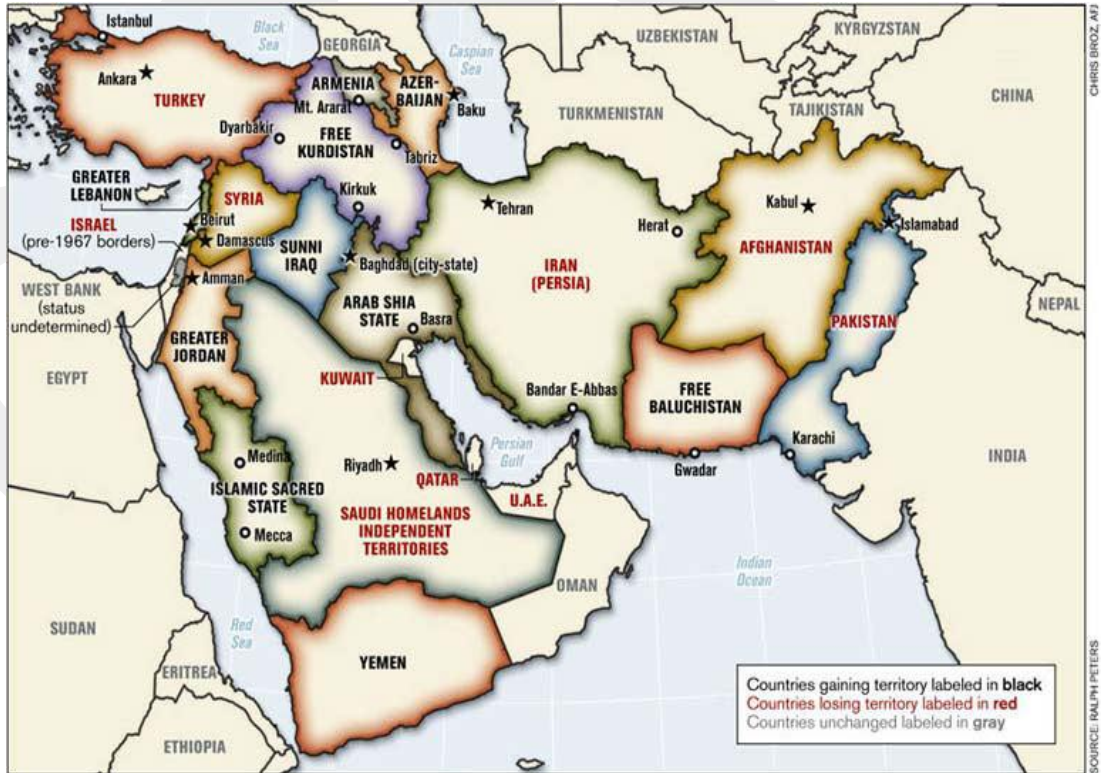
Ek 6: Misak-ı Milli sınırlarını yerle bir eden Büyük Orta Doğu Projesi'nin haritası.

http://www.amerikaliturk.com/news/guncel/26575-cuval-olayinin-yil-doenuemue/ , Erişim: 15.12.2012.