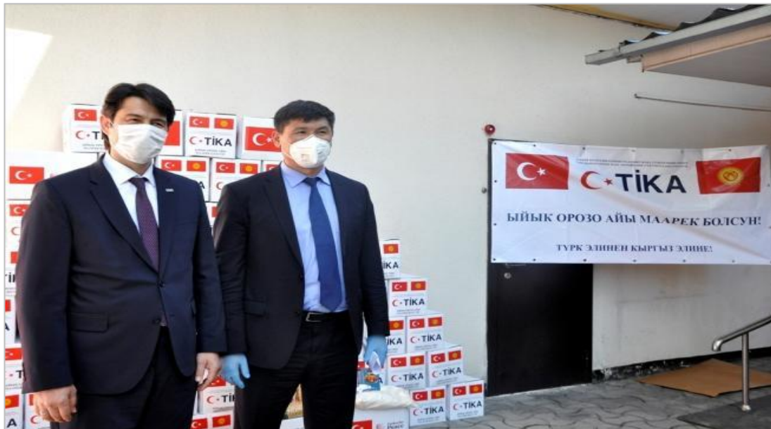
Şekil 10. Türkiye Kültür ve Turizm Bakanlığı ile TİKA'nın Maske ve Antiseptik Solüsyon Yardım Malzemelerinin Kırgızistan Çalışma ve Sosyal Kalkınma Bakanlığına Teslimi

Türkiye Covid-19 salgını sürecinde kardeş ülke Kırgızistan'ı yalnız bırakmayarak salgın ile mücadelede gerekli tıbbi malzemeler göndermiştir. Bu süreçte Türkiye Kırgızistan'a PCR testi göndermiş, covid hastası olduğu tespit edilen kişilerin tedavisinin yapılmasında önemli ölçüde destek olmuştur.