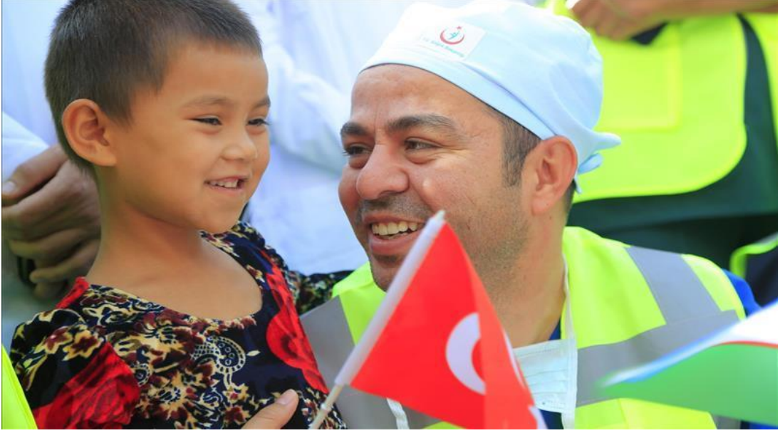
Şekil 19. Türk Yardım Kuruluşları Tarafından Özbekistan'da Sağlık ve Diğer Alanlarda Hayata Geçirilen Projeler

“Özbekistan'da ilk kez 2019 yılında Türk-Özbek sağlık iş forumu düzenlendi. Foruma Özbekistan ile Türk Konseyi üyesi ülkeler katılmıştır. Foruma Türk yatırımcıları temsil eden yaklaşık 80 firma katıldı. Ayrıca Türk-Özbek sağlık iş forumunun bir parçası olarak Sağlık Haftası düzenlendi. Etkinlik sırasında Türkiye'den 27 cerrah Taşkent'teki üç hastanede çeşitli ameliyatlara gerçekleştirmişlerdir” (Vakilov, 2019).