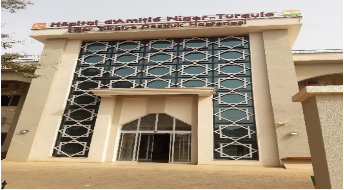
Şekil 6. Türkiye Nijer Dostluk Hastanesi

Türkiye dış politika bağlamında yabancı ülkelere yapmış olduğu yardımları genel olarak TİKA vasıtasıyla gerçekleştirmektedir. TİKA tarafından 2019 yılında inşası tamamlanarak hizmete açılan "Nijer Ana Çocuk Sağlığı Hastanesi ve Rehabilitasyon Merkezi" de Türkiye'nin Nijer'e yapmış olduğu yardımlardan biridir. Türkiye insani sorumluluk bilinciyle Nijer halkının sağlığına verdiği katkı ve yardımların başında sağlık gelmektedir.