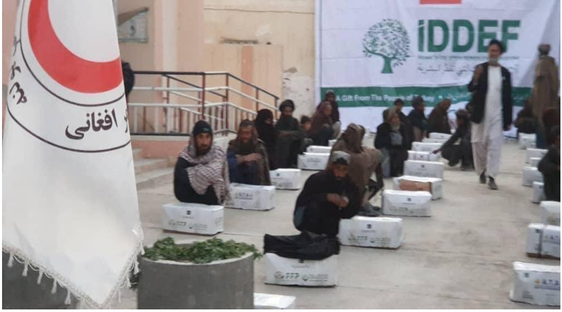
Şekil 9. İDDEF'in, Afganistan Seferberliği Devam Ediyor