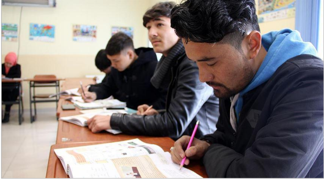
Şekil 8. Yunus Emre Enstitüsünün Afganistan'da Açtığı Kurslarda Türkçe Öğrenen Afgan Öğrenciler

göstergesi Afganistan'daki üniversitelerde yabancı diller arasında en çok tercih edilen ikinci dilin Türkçe olmasıdır. Buda Afgan devletinin ve halkının Türk insanına ve Türk diline ne derecede önem verdiklerini ortaya koymaktadır.