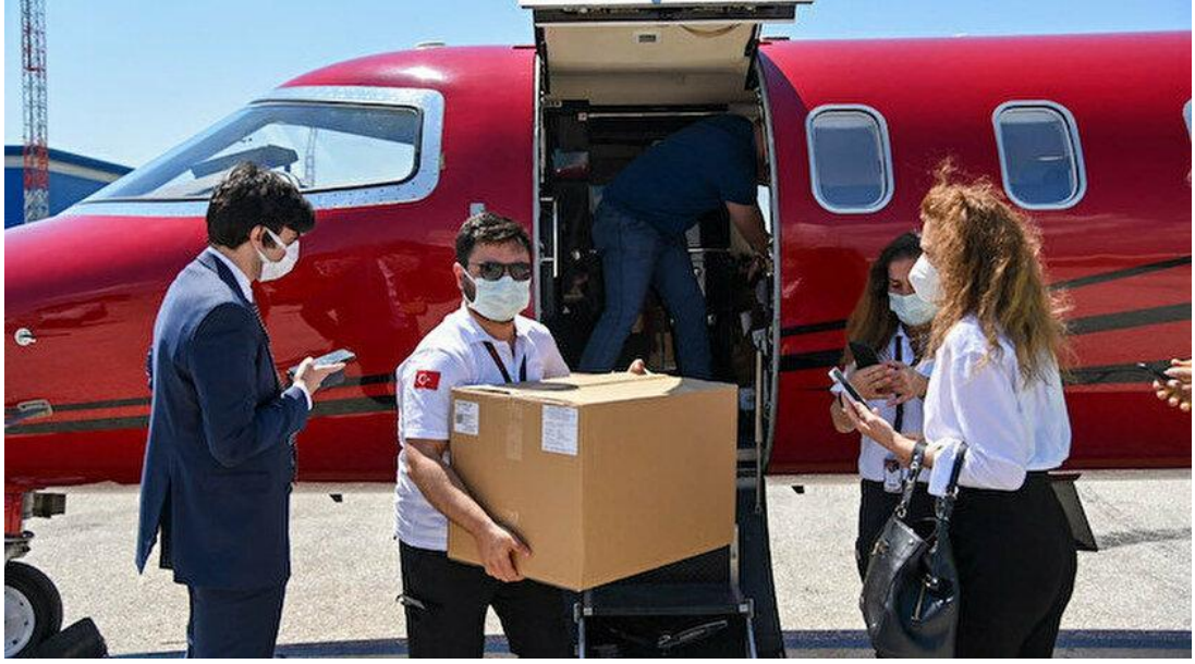
Şekil 13. Türkiye'den Kuzey Makedonya'ya 30 bin Sinovac Aşısı Desteği

“Türkiye'nin yeni tip koronavirüsle mücadele kapsamında bağışladığı 30 bin Sinovac aşısı, Kuzey Makedonya'ya ulaştı. Kuzey Makedonya Sağlık Bakanı Venko Filipçe, dost ülke Türkiye'den 30 bin Sinovac aşısının ülkeye ulaştığını belirterek, "Sunulan destek ve öncelikle bizler için önemli olan vadedilen miktarın çok hızlı bir şekilde ulaşmasından dolayı Türkiye Cumhuriyeti ve Cumhurbaşkanı Erdoğan'a bir kez daha çokça teşekkür ediyorum." ifadelerini kullandı” (Yeni Şafak, 2021).