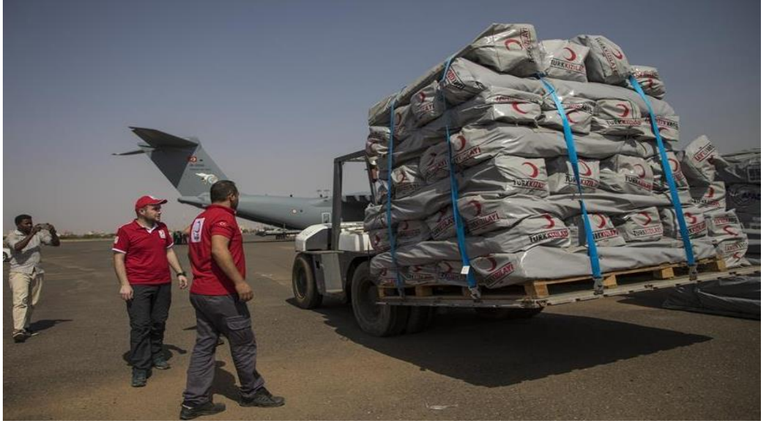
Şekil 4. Türkiye, Selden Etkilenen Sudan'a İnsani Yardım Gönderdi

“Sudan’da meydana gelen sel felaketinde zarar gören Sudan halkına Türk yardım kuruluşları Kızılay ile Afet ve Acil Durum Yönetimi Başkanlığı (AFAD) tarafından bölgeye 40 ton gıda ve yardım malzemesi taşıyan iki uçak gönderdi” (Hurriyet dailynews.com, 2019).