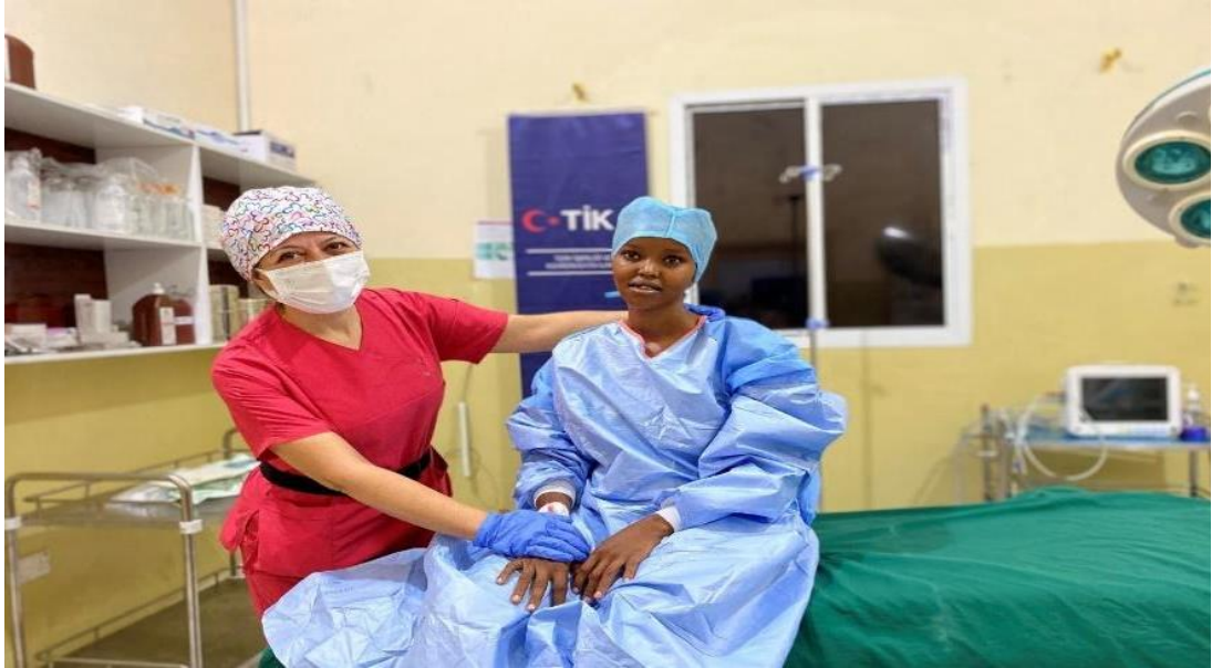
řekil 2. Somali'nin Bařkenti Mogadiřu'daki Trk Sađlık Merkezi

“Trkiye Somali'de kalpleri ve zihinleri nasıl kazanıyor? 2011'de 250.000 Somalili alıktan lrken Batı lı bađıřılar arkalarına yaslandı. Ardından Trkiye devreye girdi” (New Internationalist, 2018).