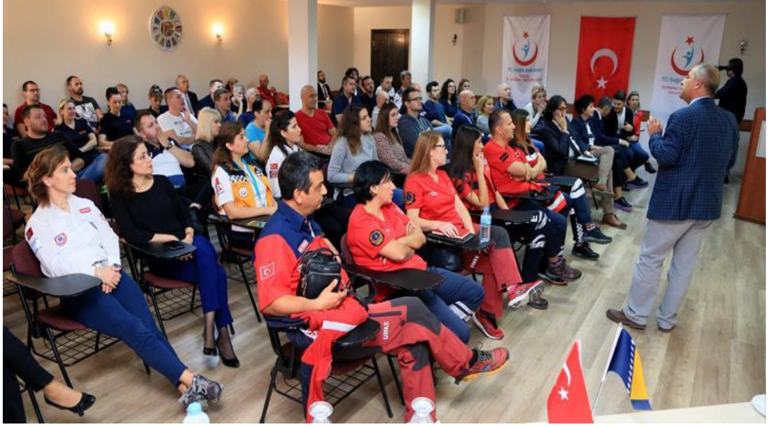
Şekil 16. Bosna Hersekli Sağlık Personeline Acil Sağlık Eğitimi

Bosna Hersek'in önemli medreselerden biri olan ve 300 civarında öğrencisi olan Cazin Cemaluddin Ef. Çauşeviç Medresesine fen dersi bölümleri (fizik, kimya ve biyoloji) için yeni laboratuvar sınıfları açılarak gerekli araç ve gereç malzemeler temin edilmiştir. Bölgede bu düzeyde tek okul olmakta olup yapılan Proje ile birlikte bölgedeki sağlık kuruluşlarına kalifiyeli eleman yetiştirilmesinin önü de açılmıştır (TİKA, 2017).