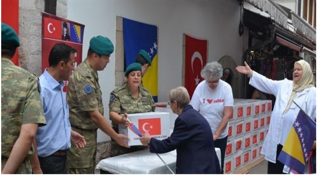
Şekil 17. Türk Askerinden Bosna Hersek'e Eğitim ve Sağlık Desteği

“Avrupa Birliği Barış Gücü (EUFOR) bünyesinde Bosna Hersek'te görev yapan Türk askeri, bölgede barışı ve istikrarı koruma faaliyetlerinin yanı sıra sağlık ve eğitim alanlarında da desteğini sürdürüyor ((Haber.com, 2017).