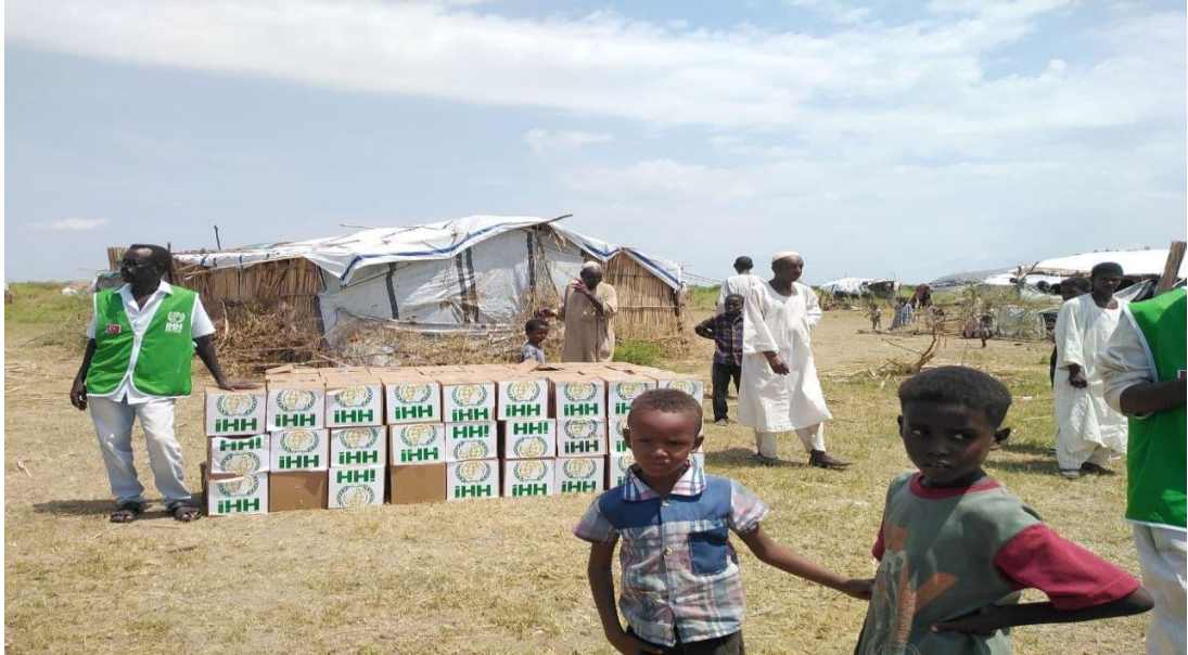
Şekil 3. Sudan'a İHH Tarafından Gönderilen Gıda ve Hijyen Ürünlerinden Oluşan Paket Yardımları

dikkatleri çekmişti. Cumhurbaşkanının 2006 yılındaki ziyareti esnasında Nyala'da halkın sağlık ihtiyaçlarını karşılayacak büyük ve modern bir hastane inşa edilmesi kararı vermişti. Sudan (Darfur) halkına sağlık hizmetlerinin çok iyi bir şekilde verilmesi amacıyla modern ve tam teşekküllü hastane yapılması için 2007 tarihinde "Sağlıkta İşbirliği Protokolü" anlaşması imzalanarak çalışmalara başlanmıştır. Hastanenin 2012 yılında inşaat çalışmaları ve donanımı bitirilmiştir. 2013 yılında ise hastanenin işletme ve devir teslim sözleşmesi imzalanmıştır. 2014 yılında Nyala Sudan Türkiye Eğitim ve Araştırma Hastanesinin açılışı gerçekleştirilerek hizmet vermeye başlamıştır. Açılışı yapılan hastane sadece sudan halkına değil, komşu ülkelerden gelen insanlara da hizmet vermektedir. Hastane 150 yatak kapasitesine sahip olup, 31 polikliniği bulunmaktadır (Sağlık Bakanlığı, 2018).