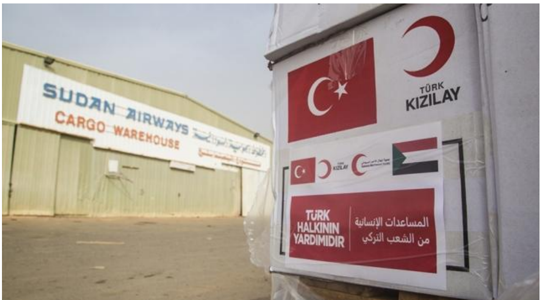
Şekil 5. Türk Kızılay Tarafından Yeni Tip Koronavirüsle (COVID-19) Mücadeleye Destek Amacıyla Sudan’a Gönderilen Tıbbi Yardımlar

Doğal afetler gelişmişlik düzeyi ne olursa olsun meydana geliş şekilleri ve zamansız olma özellikleriyle tüm ülkelere yardım ve desteği gerektiren olaylardır. Sudan’da meydana gelen sel felaketinde Sudan'a yardım yapmayı gerektirmiştir. Türkiye bu yardımı Kızılay aracılığıyla gıda AFAD aracılığıyla da sele kapılanların kurtarılması şeklinde gerçekleştirmiştir.