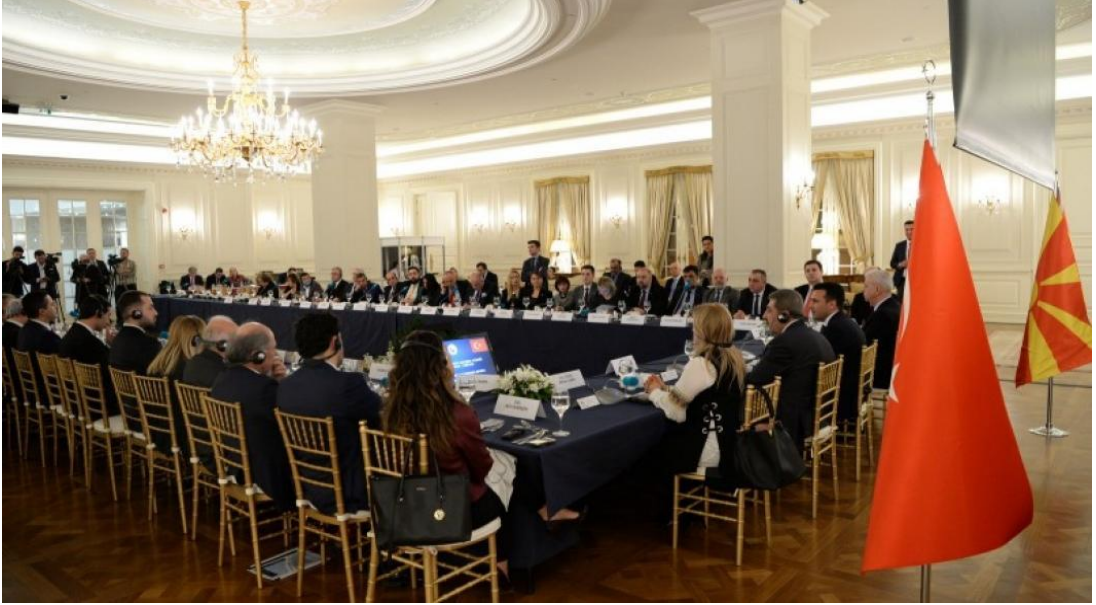
Şekil 14. Türkiye ile Makedonya Arasındaki Ekonomik İşbirliği Toplantısı

Kuzey Makedonya Başbakanı Zoran Zaev’in Türkiye ziyareti çerçevesinde Türk iş adamlarıyla bir araya gelmiştir. Zoran Zaev Türk İş adamlarından eğitim, tarım, hayvancılık, sağlık ve diğer alanlarda ülkesine daha fazla yatırım yapılmasını istemiştir. Yatırım için Makedonya’ya gidecek iş insanlarına gerekli kolaylıkların sağlanacağıda belirtilmiştir. Dünya ölçeğinde Kuzey Makedonya’ya yatırım yapan ülke sıralamasında, Türkiye 456 milyon avro bütçe ile altıncı sırada yer almaktadır.