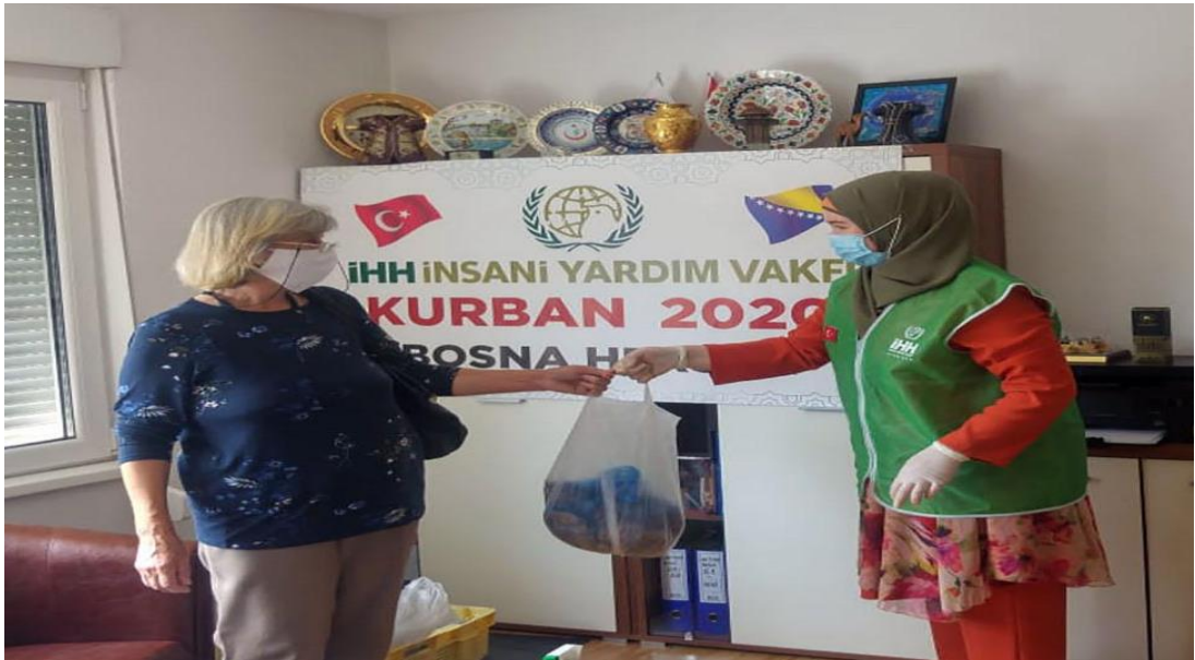
Şekil 15. Bosna Hersek'e Kurban Yardımı

Bosna Hersek'teki Saraybosna Üniversitesi Ziraat Fakültesi ile TİKA iş birliğinde başlatılan proje çerçevesinde, başta kadınlar olmak üzere işsiz, düşük gelirli ve arazi sahibi kişilerden seçilen herkese sera ve tarım donanım desteği verilecektir. Bosna Hersek'in doğusu ile orta kesiminde yer alan Srebrenica, Bratunats, Zivinice ve Vogoşça belediyelerinde yaşamlarını sürdürmeye çalışan savaş mağduru 80 ailenin her birine ayrı ayrı 100 metrekare sera yapmak için yer ile birlikte fide desteği, sulama sistemleri, eğitim ve danışmanlık gibi hizmetler sağlanmıştır (TİKA, 2018; 105).