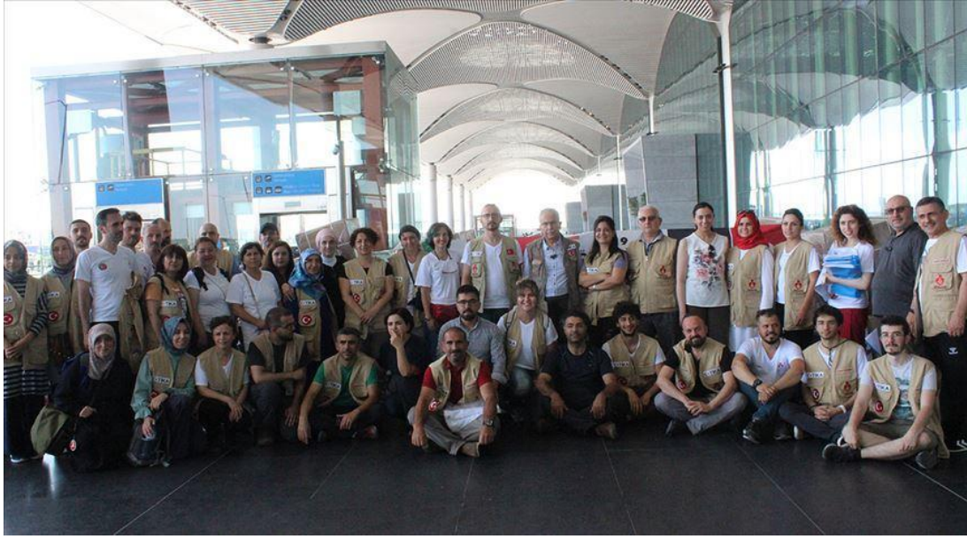
Şekil 7. Sağlık Gönüllülerinden Nijer'e 25. Yardım Seferi

Yapılan bu yardımların, insanı bir görev olmasının yanı sıra Nijer Devleti ve Nijer halkının Türkiye ve Türk halkına bakış açısında olumlu bir değişim getirmesi beklenen bir durumdur.