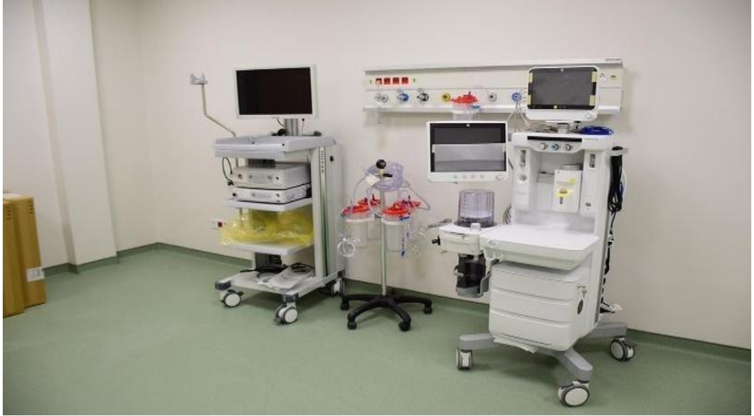
Şekil 20. Türkiye-Arnavutluk Fier Dostluk Hastanesi

“Türkiye tarafından inşa edilen 150 yataklı Türkiye-Arnavutluk Fier Dostluk Hastanesinin açılışı yapılarak hizmet vermeye başlamıştır. Bu hastane Arnavutluk sađlık altyapısına önemli katkılar sađlayacaktır (Sabah, 2021).