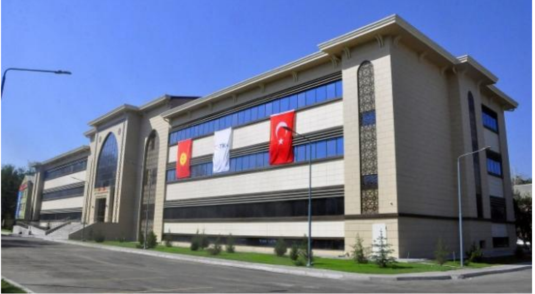
Şekil 11. Kırgız-Türk Dostluk Devlet Hastanesi

Türkiye kardeş ülke Kırgızistan'ın başkenti Bişkek'te Kırgız halkının sağlık alanında daha iyi hizmet almaları amacıyla, 2016 yılında temelini attığı Kırgızistan Türk Dostluk Hastanesi, 2018 yılında açılışı yapılarak hizmet vermeye başlamıştır. Bu hastane, bir yıla yakın sağlık taraması ve muayenelerin yapıldığı bir sağlık kuruluşudur. Ancak covid salgınıyla birlikte, sadece covid hastalarına hizmet veren bir pandemi hastanesine dönüşmüştür. Yapılan bu hizmet, Kırgızistan Hükümeti ile Türkiye arasındaki bir dostluk köprüsü olmuştur.