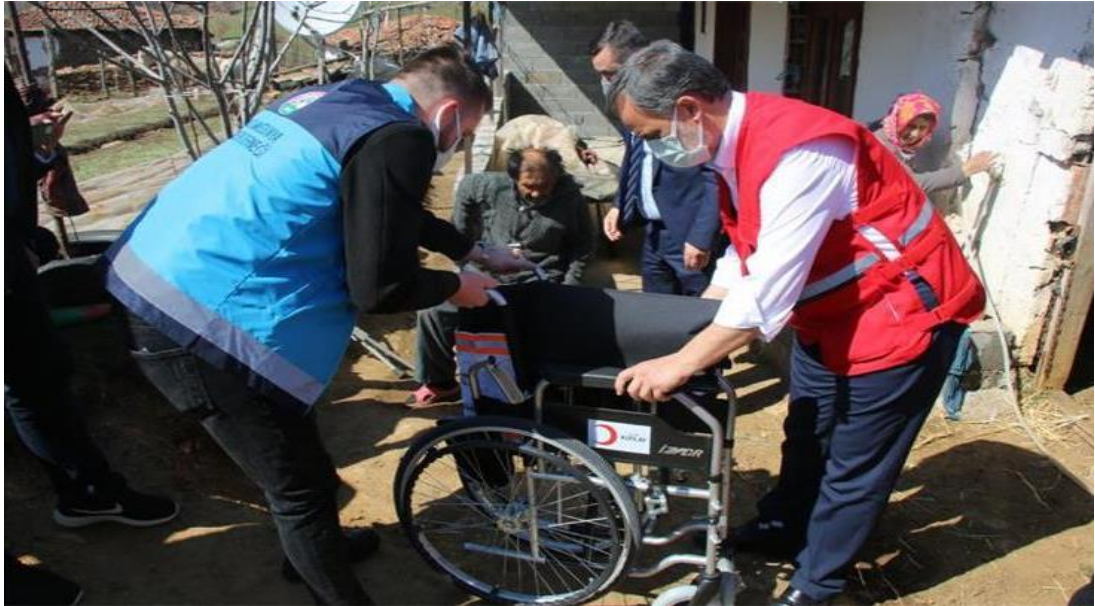
Şekil 12. Kızılay'dan Makedonya'ya Tekerlekli Sandalye ve İşitme Cihazı Desteğı

Kızılay, yurt içinde olduğu gibi yurt dışında da yardıma ihtiyacı olan insanların yüzlerindeki gülümseme olmayı sürdürüyor. Kuzey Makedonya Çalışma ve Sosyal Politikalar Bakanlığı ve Kuzey Makedonya Kızıldağı ile birlikte iş birliğı yapan Kızılay, destek olmak için 50'si çocuk ve 50'si yetişkin hasta olmak üzere 25 işitme cihazı, 500 hijyen paketi ve 100 tekerlekli sandalye teslim etti. Kızılay yetkilileri tarafından verilen bilgi kapsamında, bugüne kadar Kuzey Makedonya'da muhtaç insanlara yapılan yardımların bundan sonrada devam edeceği belirtildi (Kızılay, 2021).