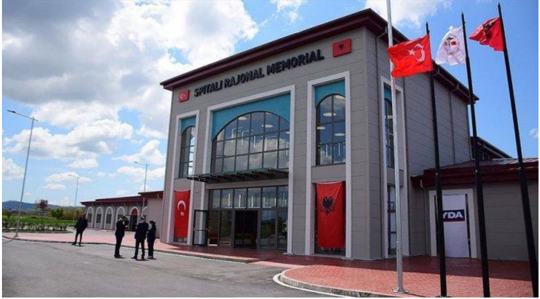
Şekil 21. Türkiye'nin Tarafından İnşa Edilen Türkiye-Arnavutluk Fier Dostluk Hastanesi

Türkiye en zor zamanlarında Arnavutluk'un yanında yer alarak bu ülkenin ihtiyaç duyduğu yardım desteğini vermiştir. Yapılan yardım desteklerinden biri olan; Türk Kızılayı'nın, geleceğin teminatı olan çocuklar için Arnavutluk'un Tiran şehrinde bulunan Mustafa Kemal Atatürk Okulu'nda okul öncesinden liseye kadar eğitim gören öğrencilere kırtasiye ve okul çantası gibi malzeme desteğinde bulunması iki ülkenin dostluk ilişkisinde önemli bir girişimdir.