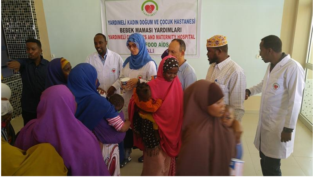
Şekil 1. Yardımeli Derneği Tarafından Açılan Somali “Kadın Doğum ve Çocuk Hastanesi”

sürede içerisinde Afrika ülkelerine yönelik faaliyetler de bulunmaya başladılar. Bu faaliyetler daha çok gönüllü doktorların değişik Afrika ülkelerinde kısa süreli ziyaretlerle gerçekleştirdikleri sağlık taramaları şeklinde olmuştur. Gönüllü başlayan bu çalışmalara zamanla TİKA ve Sağlık Bakanlığı da gerekli desteği vererek bu tür faaliyetlerin ivme kazanmasını sağlamıştır (Çomak, 2011, s.203).